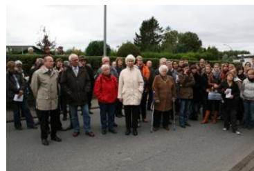
Verlegung im Giddendorfer Weg

1938 taucht Siegfried Rosenblums Name auf einer Deportationsliste des KZ Sachsenhausen auf. Er wurde zunächst ins Konzentrationslager Fuhlsbüttel verbracht und am 8.11.1941 nach Minsk deportiert.