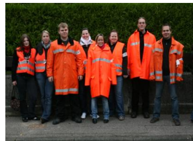
ErzieherschülerInnen sorgen für einen sicheren Ablauf der Veranstaltung

„Wir danken allen, die uns bei den Recherchen unterstützt haben. Besonderer Dank gilt auch denjenigen, die durch ihre Spenden die Finanzierung der Stolpersteine unterstützt und überhaupt erst ermöglicht haben.“