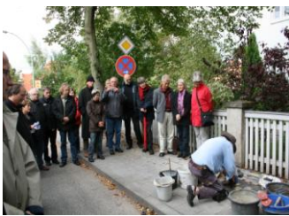
Verlegung in der Hoheluftstr.